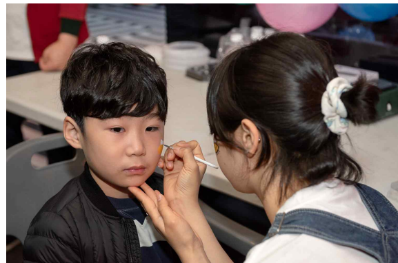
▲ 페이스 페인팅