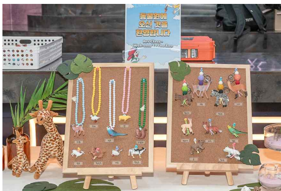
▲ 동물 피규어 목걸이 키링 만들기