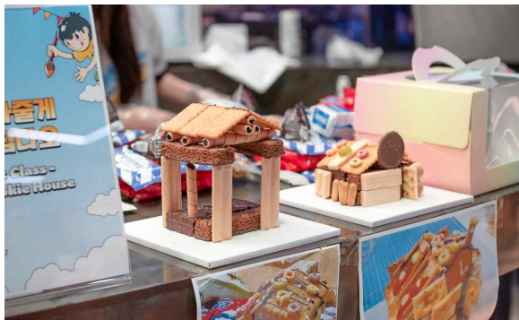
▲ 과자집 만들기