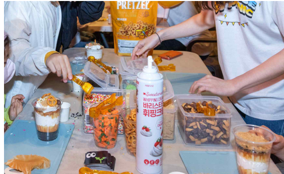
▲ 화분케이크 만들기