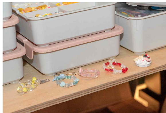
▲ 비즈 악세사리 만들기